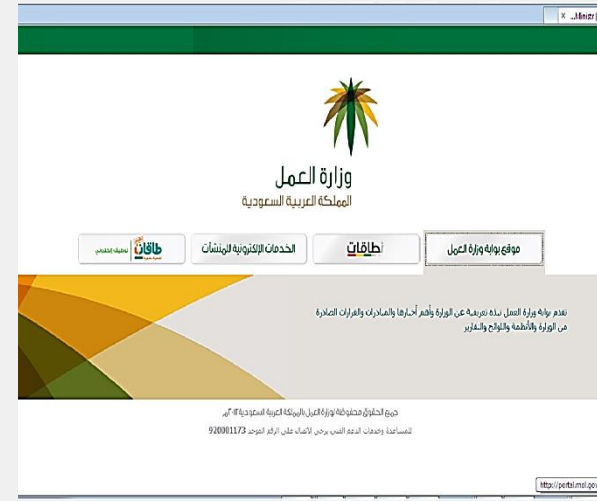
موقع وزارة العمل