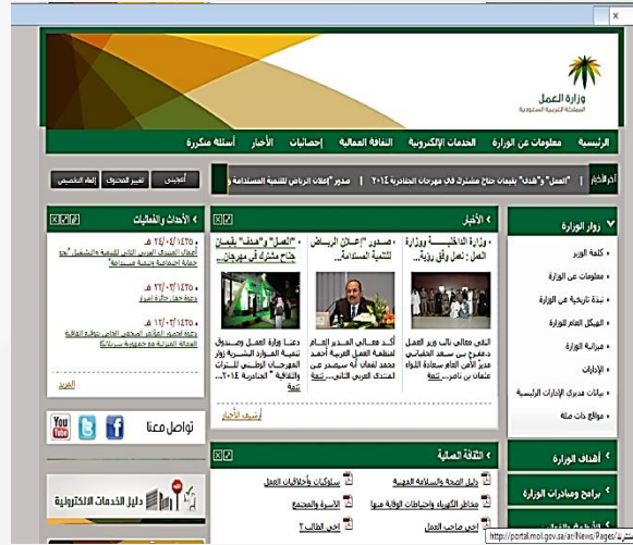
بوابة وزارة العمل