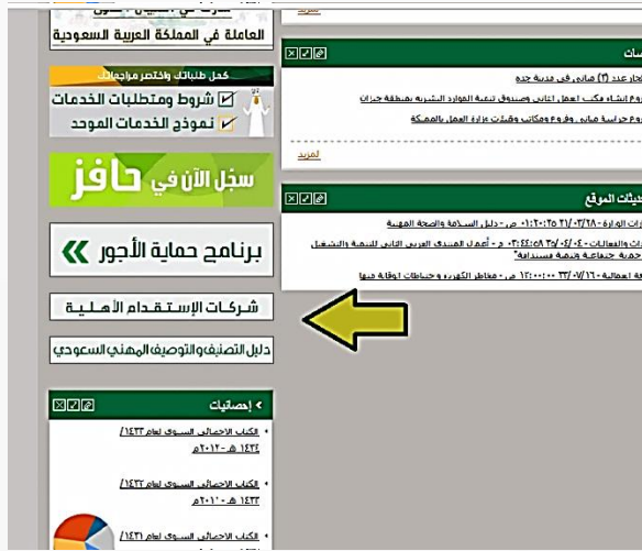
رابط شركات الاستقدام